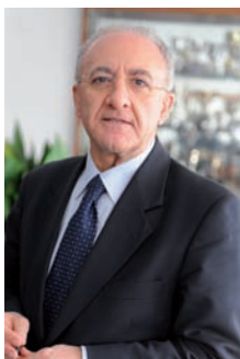
Vincenzo De Luca Sindaco di Salerno

Presento, a nome mio personale e della Civica Amministrazione, con particolare soddisfazione questa pubblicazione che rappresenta l'importante tassello di una benemerita attività sociale e scientifica volta a divulgare i benefici della medicina omeopatica.