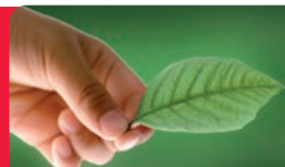
TAVOLA DELLE OMOTOSSICOSI