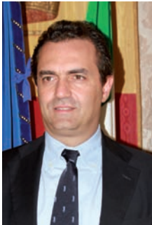
Luigi de Magistris Sindaco di Napoli

Cari amici, Saluto con soddisfazione la pubblicazione che avete fra le vostre mani. Un vademecum pensato per informarvi in modo puntuale sulla medicina omeopatica e che costituirà un prezioso alleato per la vostra salute.