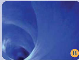
Foto B: Acqua esposta a luce WHITE con filtri ottici utilizzati per i F.d.B. Guna. Si notano più spirali organizzate secondo dinamiche frattali; il fenomeno è dovuto alla minore viscosità dell'acqua generata dalla supercoerenza".

Foto A: Acqua Normale. Si nota un unico vortice regolare e singolo