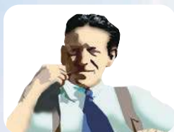
Dr. Edward Bach

I Fiori di Bach sono 38 preparati a base di fiori e piante (in effetti sono 36 le varietà di fiori oltre alla gemma dell'ippocastano e all'acqua sorgiva di fonti note per le loro particolari proprietà), utilizzati come sussidi naturali nelle situazioni di disagio emotivo, secondo l'intuizione di un medico di origini gallesi, il Dr. Edward Bach, vissuto in Gran Bretagna nei primi anni del secolo scorso.